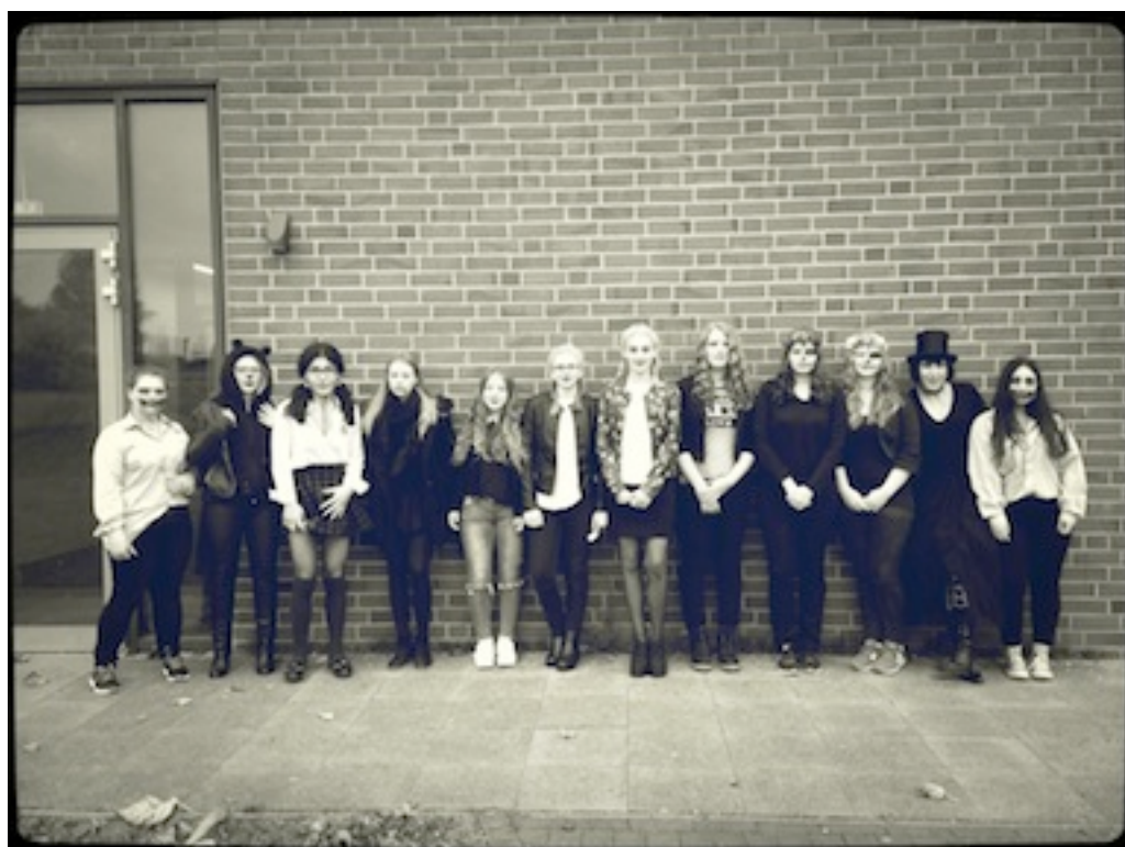
Verkleidungen ftw! #halloween2016 #gruselig #bloodymary

Das gelang auch mehr oder weniger...das muss das nächste Mal noch besser laufen. Trotzdem war es dennoch eine angenehme Atmosphäre. Hier einige Impressionen: