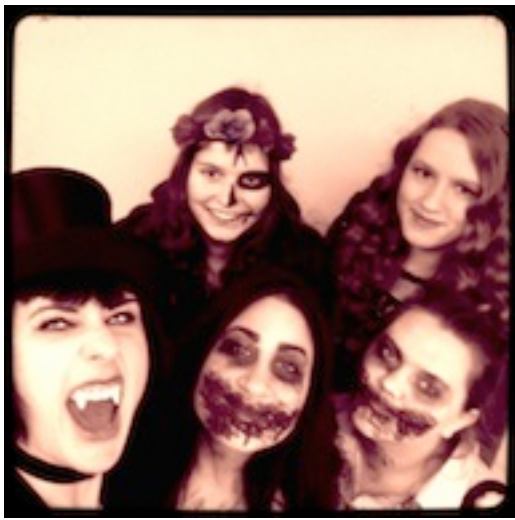
Klasse 10a : Wir unterrichten gerne!